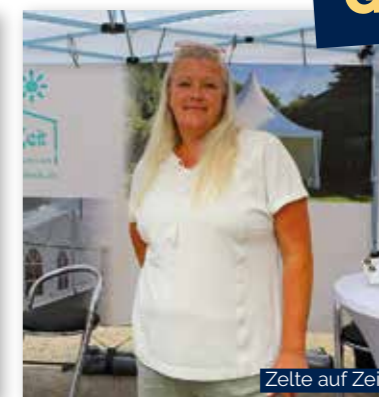
Zelte auf Zeit