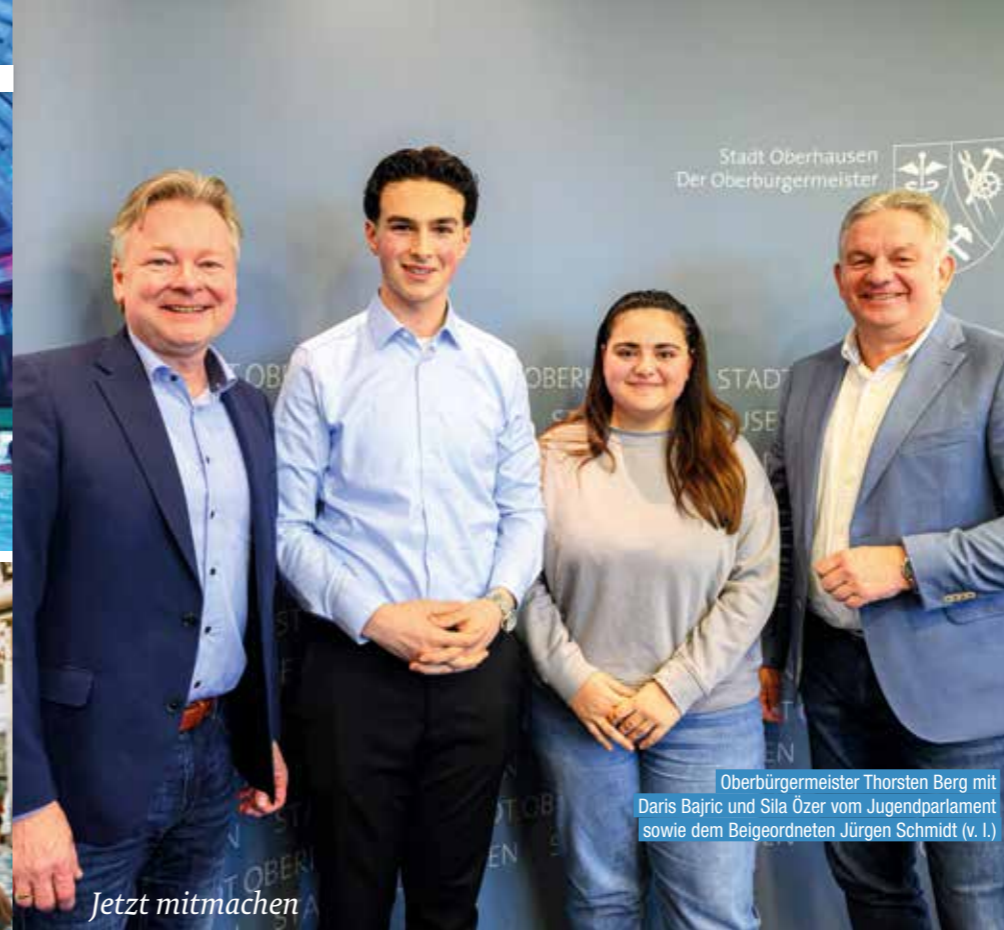
Oberbürgermeister Thorsten Berg mit Daris Bajric und Sila Özer vom Jugendparlament sowie dem Beigeordneten Jürgen Schmidt (v. l.)

Wer auch bei Midnight Island dabei sein möchte und mindestens 18 Jahre alt ist, sollte sich schnell seine Tickets im Online-Shop unter shop.aquapark-oberhausen.com sichern. Alle Infos zu Midnight Island und weiteren Veranstaltungen gibt's auf www.aquapark-oberhausen.com sowie auf den Social-Media-Kanälen des AQUAParks.