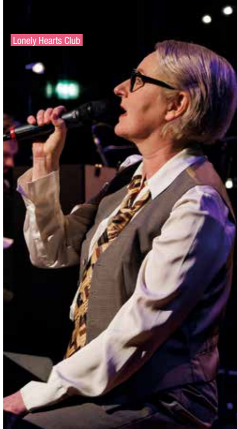
Lonely Hearts Club