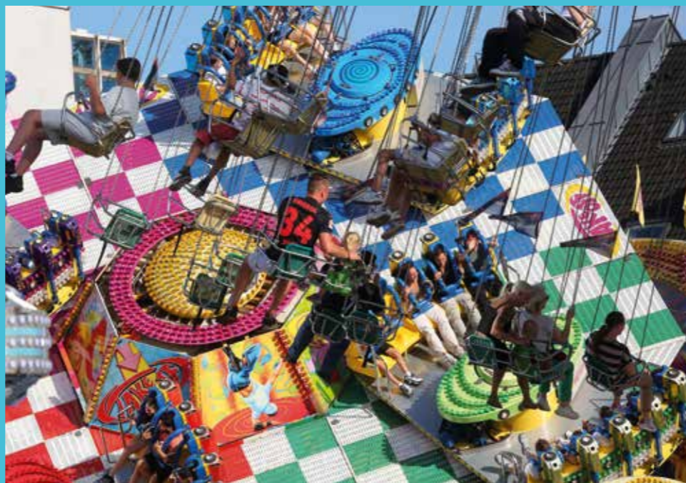
▲ Sterkrader Fronleichnamskirmes: Neue Attraktionen und traditionelles Vergnügen S. 32