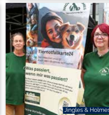
Jingles & Holmes