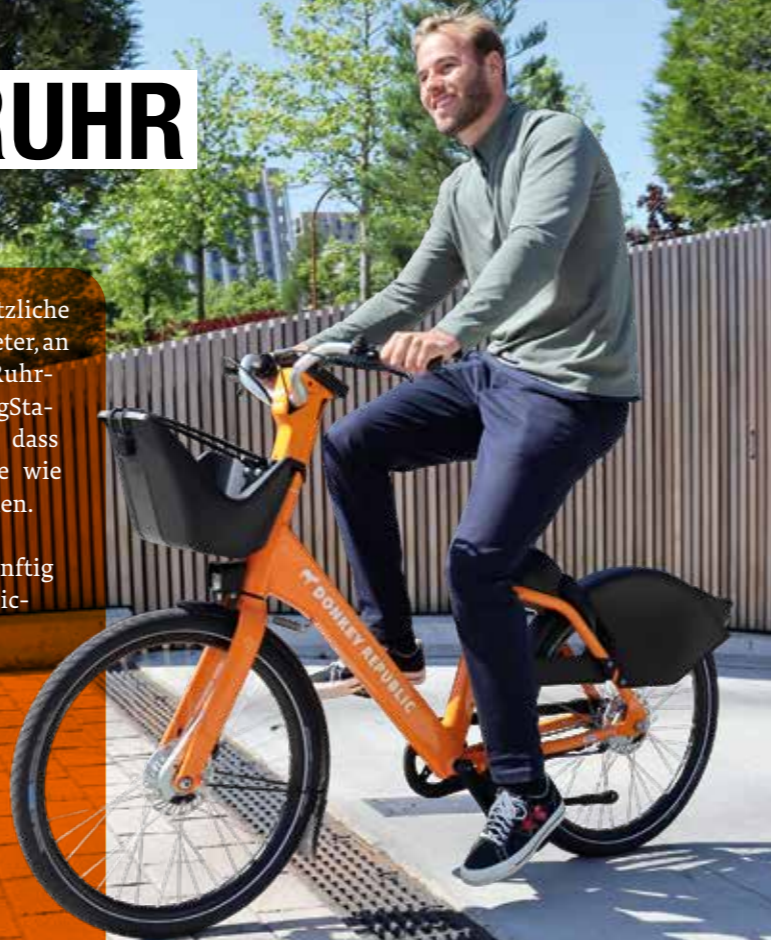
Mehr Infos auf www.metropolradruhr.de

Die Nutzung erfolgt künftig über die Donkey-Republic-App: Fahrrad auswählen, per Smartphone entsperren und losfahren. Neu ist, dass das Rad nach der Fahrt ebenfalls digital über die App abgeschlossen wird. Die Preise bleiben günstig: Eine Stunde kostet einen Euro, maximal zehn Euro pro Tag. Monats- und Jahrestarife mit Freiminuten runden das Angebot ab.