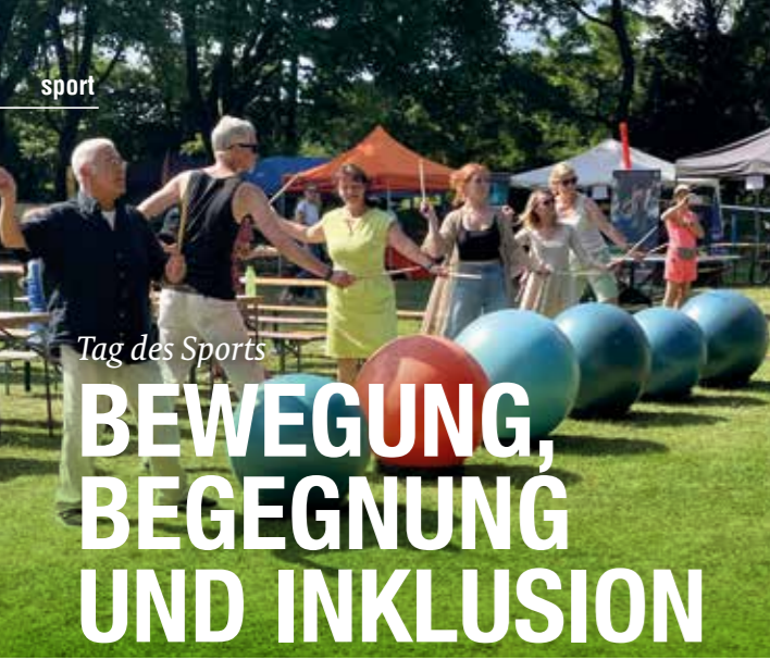
Tag des Sports