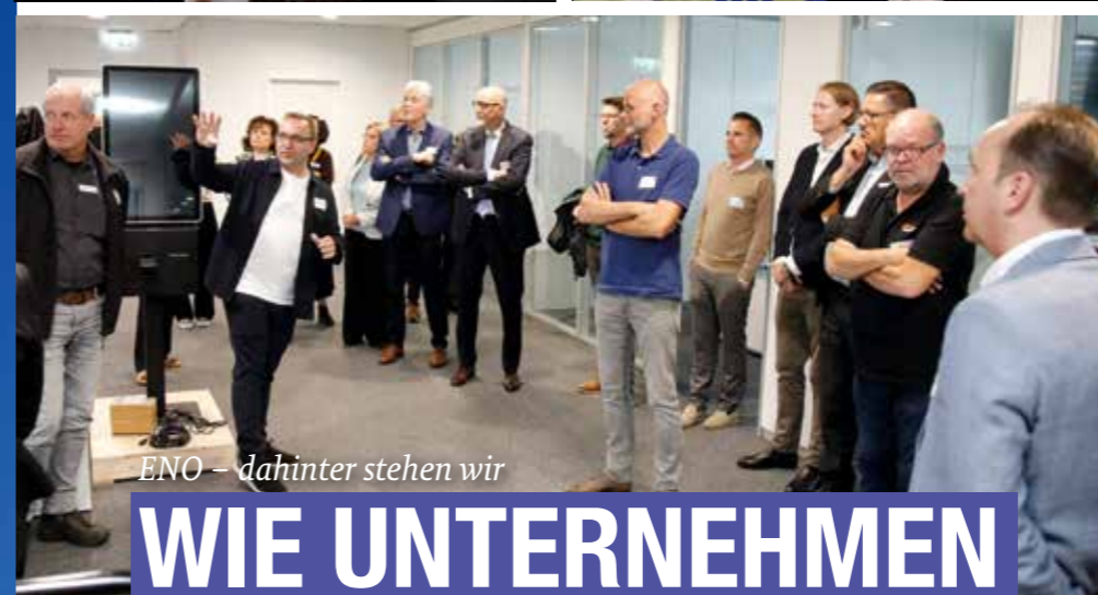
ENO – dahinter stehen wir