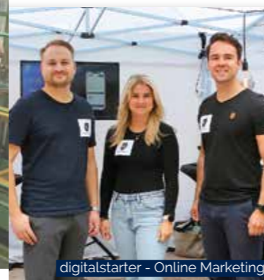
digitalstarter - Online Marketing