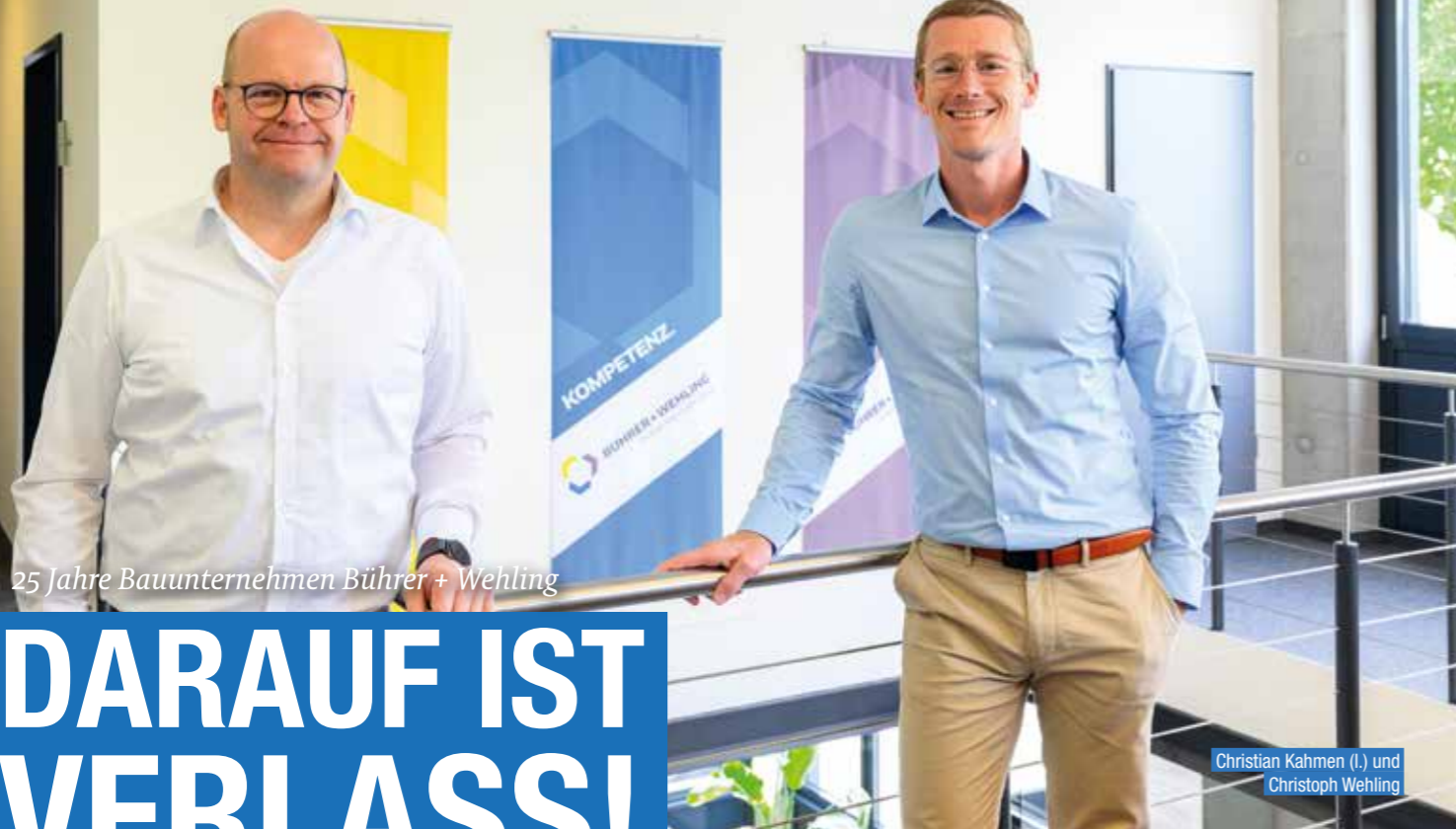
25 Jahre Bauunternehmen Bührer + Wehling