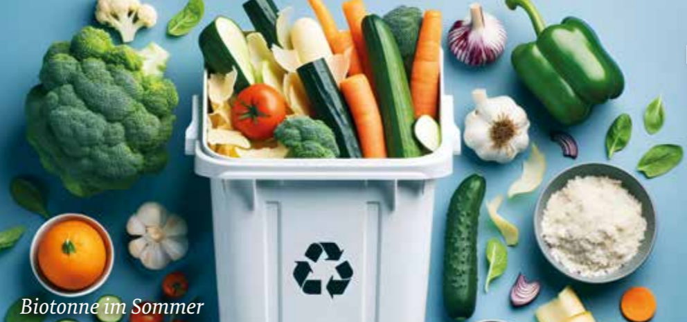
Biotonne im Sommer