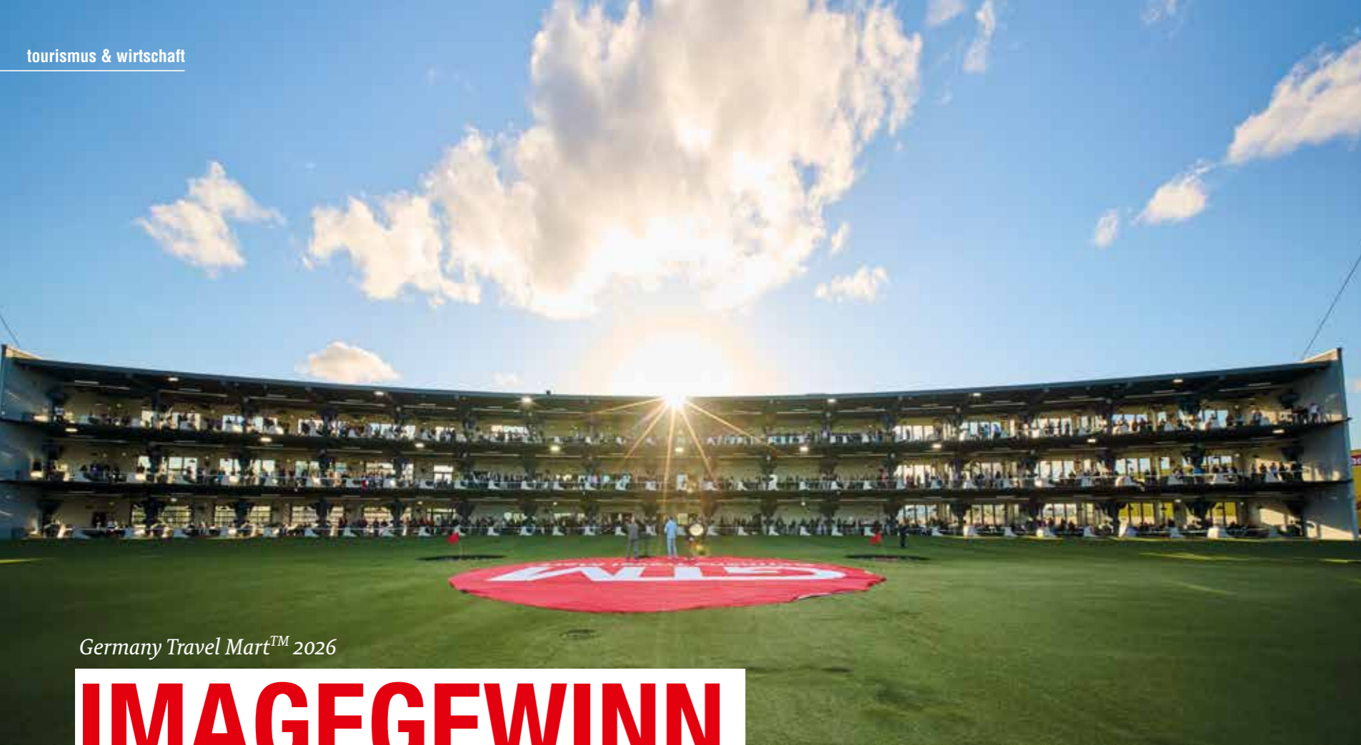
Germany Travel Mart™ 2026