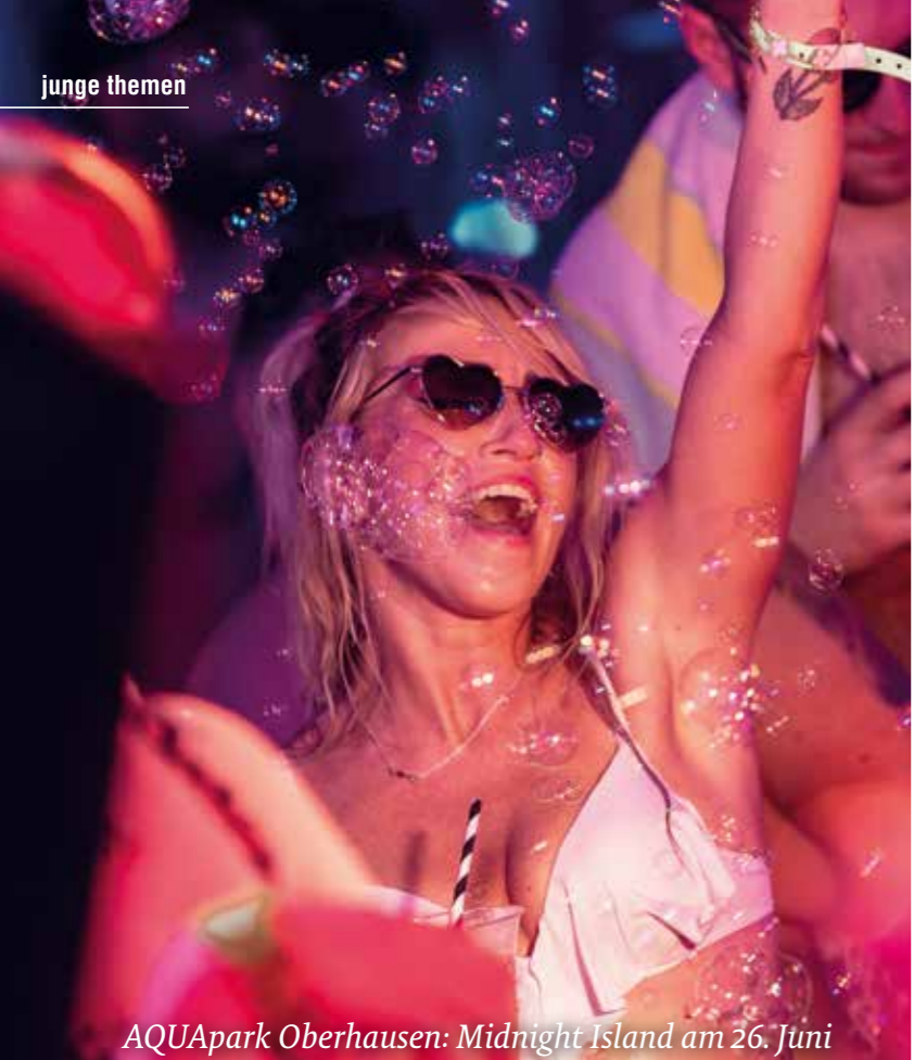
AQUApark Oberhausen: Midnight Island am 26. Juni