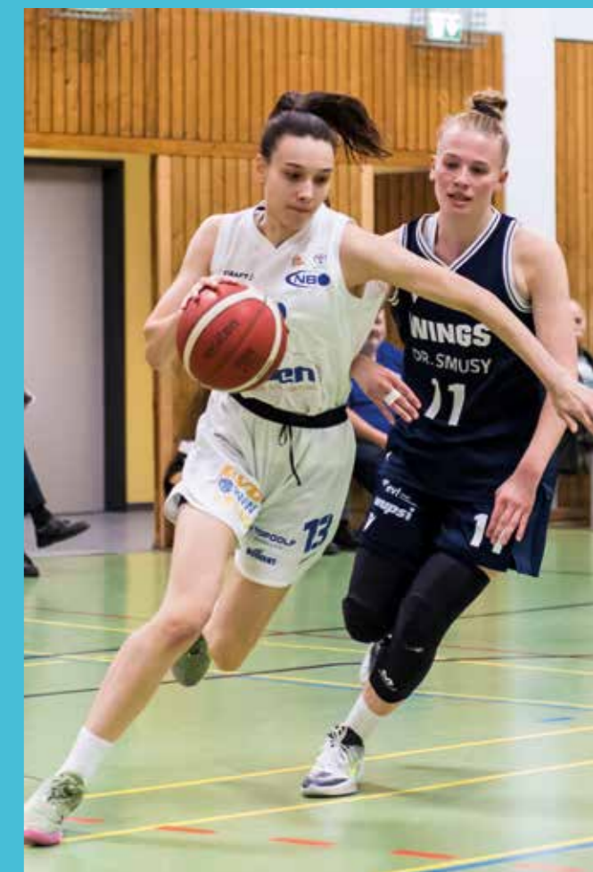
▼ New Basket Oberhausen: Klassenerhalt nach rundum erfolgreicher Saison S. 45