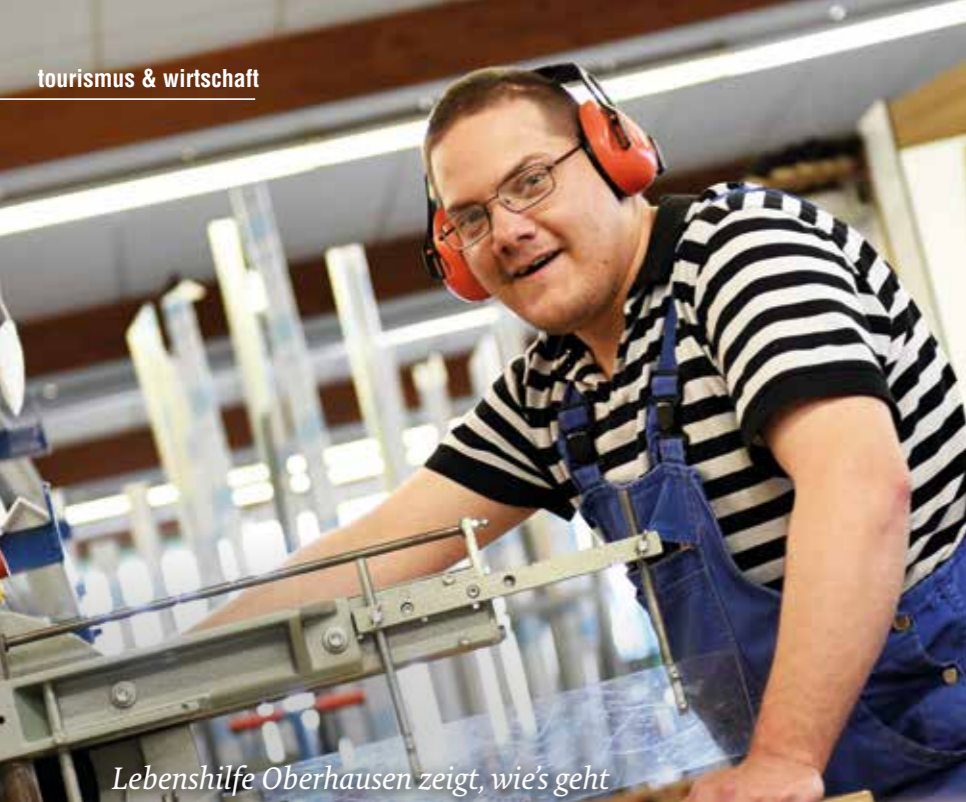
Lebenshilfe Oberhausen zeigt, wie's geht