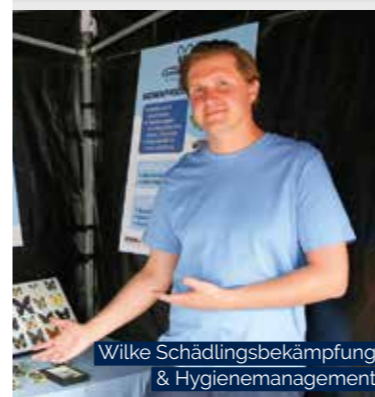
Wilke Schädlingsbekämpfung & Hygienemanagement