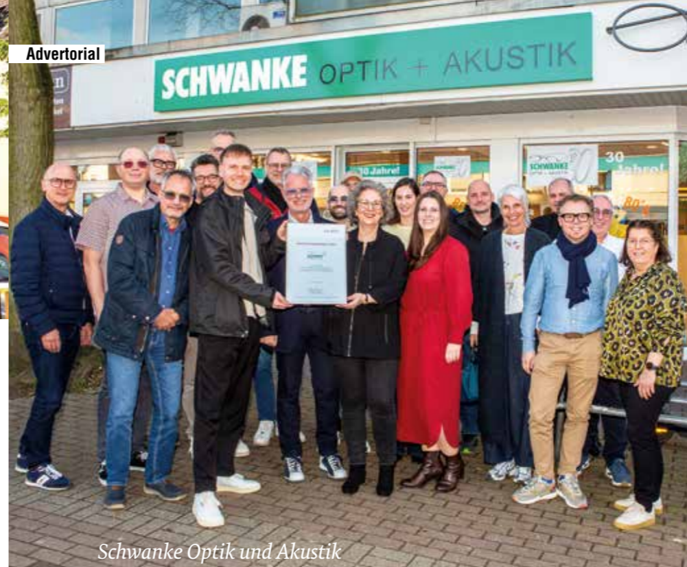
Schwanke Optik und Akustik