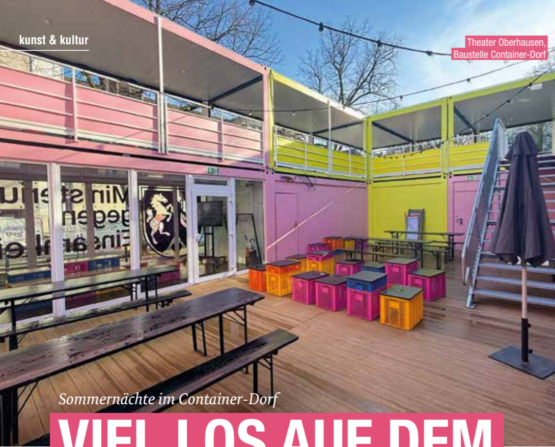
Sommernächte im Container-Dorf